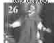
26. അമ്മമാരിൽ വിളമ്പലിന്റെ അമ്മമാരിൽ