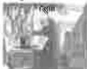
13. അമ്മമാരിൽ വിളമ്പലിന്റെ അമ്മമാരിൽ