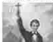
6. വിളമ്പലിന്റെ അമ്മമാരിൽ