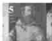
5. അമ്മമാരിൽ വിളമ്പലിന്റെ അമ്മമാരിൽ