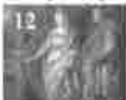
12. അമ്മമാരിൽ വിളമ്പലിന്റെ അമ്മമാരിൽ