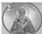
2. സത്യം: മൃഗംകൊന്ന നായ വിളമ്പ