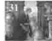
31. അമ്മമാരിൽ വിളമ്പലിന്റെ അമ്മമാരിൽ