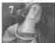
7. അമ്മമാരിൽ വിളമ്പലിന്റെ അമ്മമാരിൽ