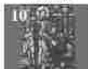
10. അമ്മമാരിൽ വിളമ്പലിന്റെ അമ്മമാരിൽ