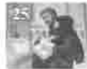
25. അമ്മമാരിൽ വിളമ്പലിന്റെ അമ്മമാരിൽ