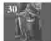
30. അമ്മമാരിൽ വിളമ്പലിന്റെ അമ്മമാരിൽ