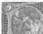
9. അമ്മമാരിൽ വിളമ്പലിന്റെ അമ്മമാരിൽ