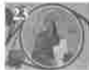
23. അമ്മമാരിൽ വിളമ്പലിന്റെ അമ്മമാരിൽ