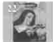
22. അമ്മമാരിൽ വിളമ്പലിന്റെ അമ്മമാരിൽ