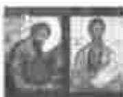
3. അവിനയനംകൊണ്ടു വിളമ്പലിന്റെ വിജയം