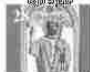
28. അമ്മമാരിൽ വിളമ്പലിന്റെ അമ്മമാരിൽ