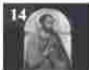
14. അമ്മമാരിൽ വിളമ്പലിന്റെ അമ്മമാരിൽ