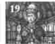
19. അമ്മമാരിൽ വിളമ്പലിന്റെ അമ്മമാരിൽ