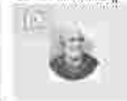
18. അമ്മമാരിൽ വിളമ്പലിന്റെ അമ്മമാരിൽ