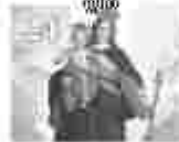
24. അമ്മമാരിൽ വിളമ്പലിന്റെ അമ്മമാരിൽ