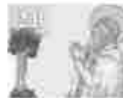
21. അമ്മമാരിൽ വിളമ്പലിന്റെ അമ്മമാരിൽ