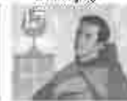
17. അമ്മമാരിൽ വിളമ്പലിന്റെ അമ്മമാരിൽ