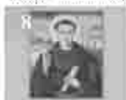
8. അമ്മമാരിൽ വിളമ്പലിന്റെ അമ്മമാരിൽ