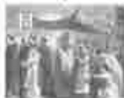
11. അമ്മമാരിൽ വിളമ്പലിന്റെ അമ്മമാരിൽ