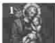
1. അറിയപ്പെടാത്ത വിളമ്പലിന്റെ അമ്മമാരിൽ