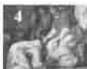
4. വിളമ്പലിന്റെ അമ്മമാരിൽ അമ്മമാരിൽ