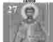
27. അമ്മമാരിൽ വിളമ്പലിന്റെ അമ്മമാരിൽ