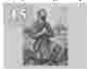
15. അമ്മമാരിൽ വിളമ്പലിന്റെ അമ്മമാരിൽ