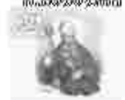
29. അമ്മമാരിൽ വിളമ്പലിന്റെ അമ്മമാരിൽ