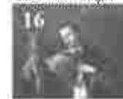
16. അമ്മമാരിൽ വിളമ്പലിന്റെ അമ്മമാരിൽ